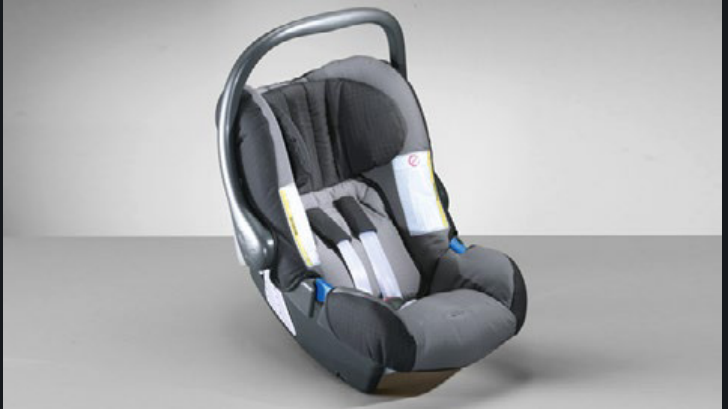
SILLA PARA BEBÉ