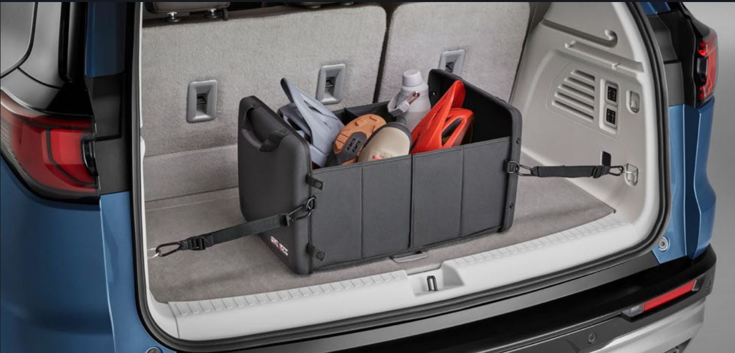
ORGANIZADOR DE CAJUELA COLAPSABLE