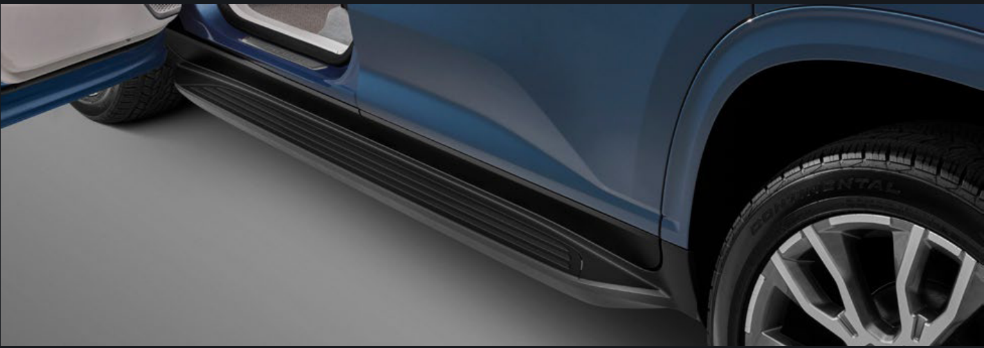
ESTRIBOS MOLDEADOS EN NEGRO