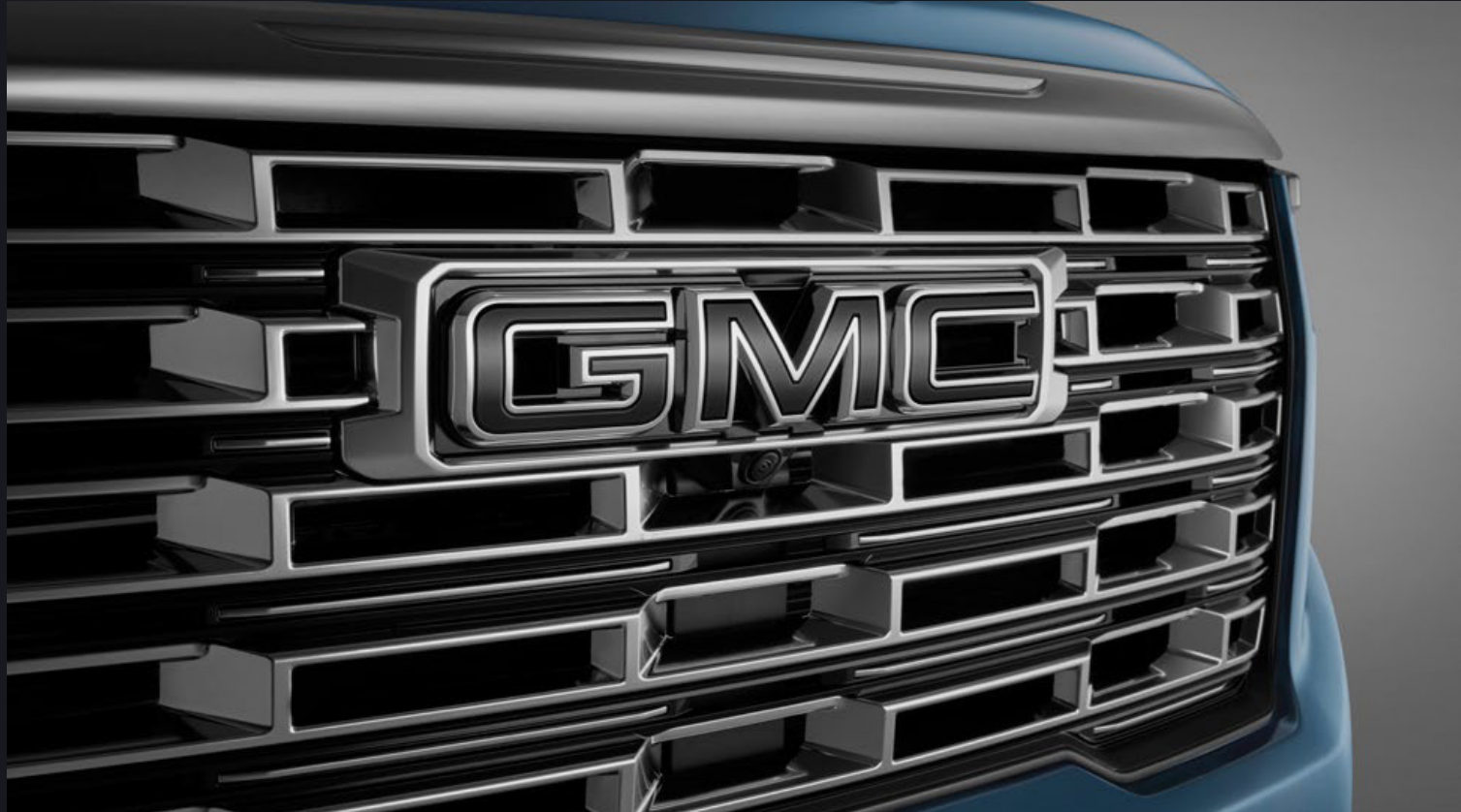
EMBLEMA FRONTAL Y TRASERO GMC