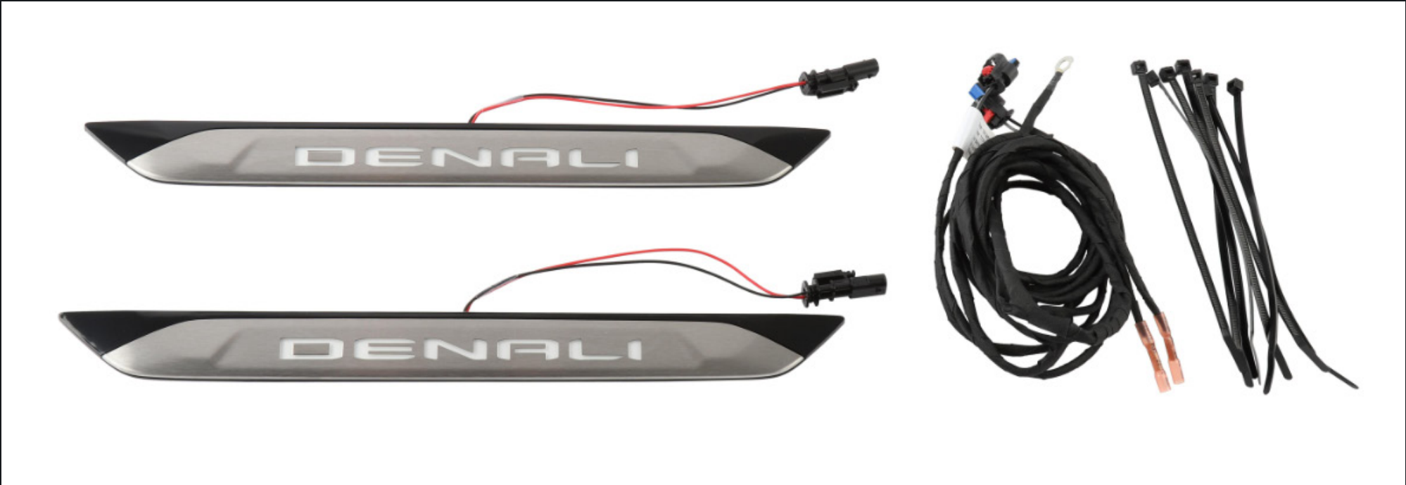
PROTECTOR DE SOLERA ILUMINADO (ILLUMINATED DOOR SILLS M1 (SOM) [ACCESSORY])