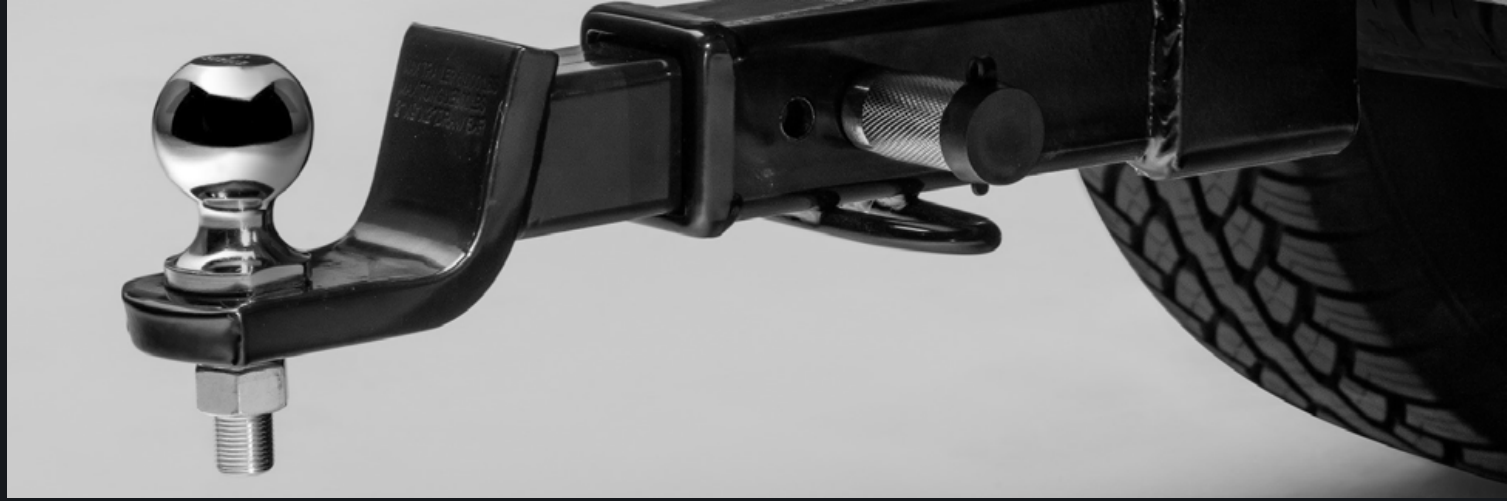
BOLA DE ARRASTRE