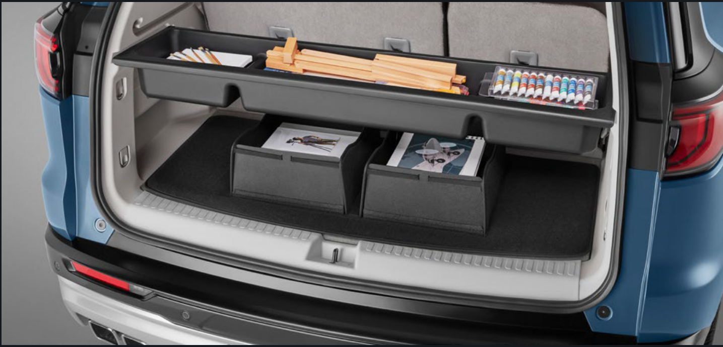
BANDEJA ORGANIZADORA CON DIVISORES