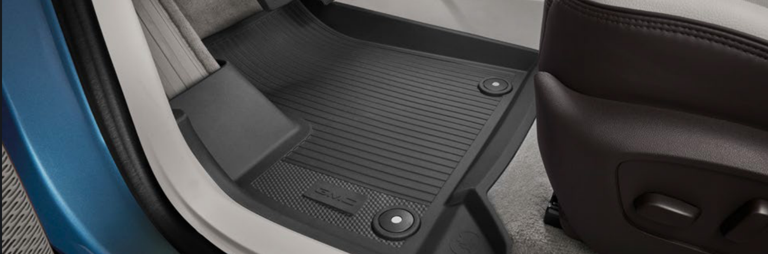
TAPETE DE VINIL RÍGIDO DE 1ERA FILA EN NEGRO CON LOGO GMC