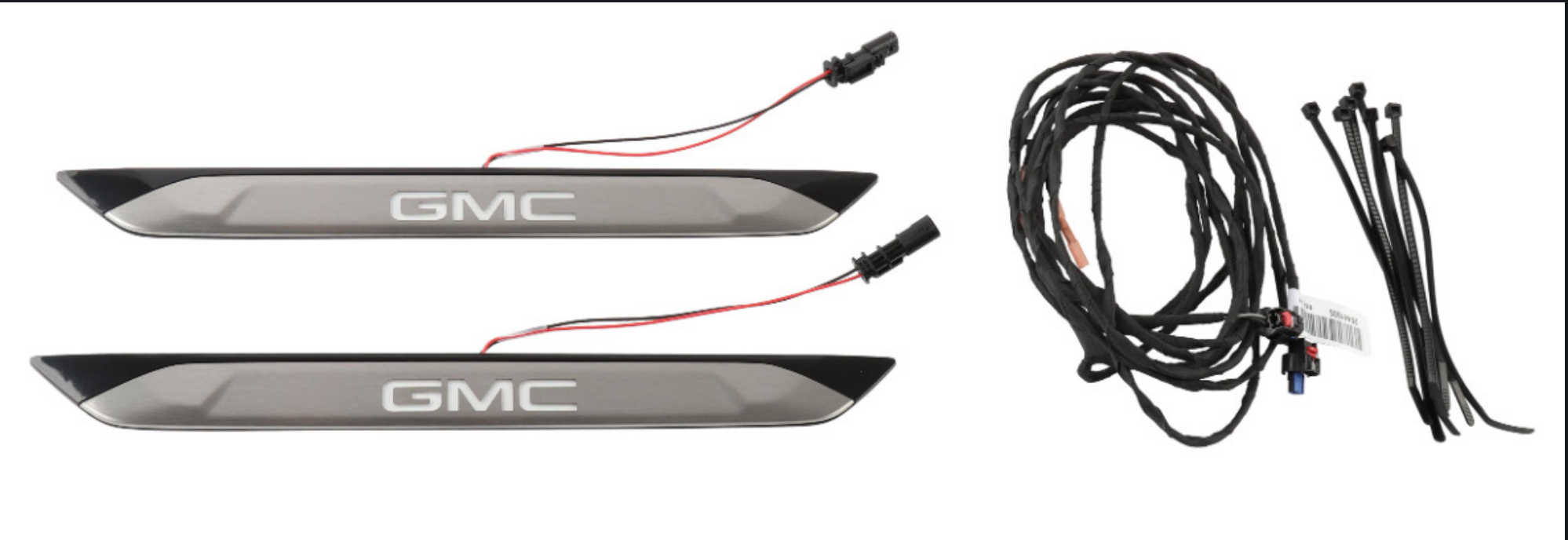
PROTECTOR DE SOLERA ILUMINADO (ILUMINATED DOOR SILLS) CON LOGO GMC