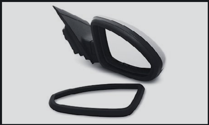
PROTECTOR DE ESPEJO