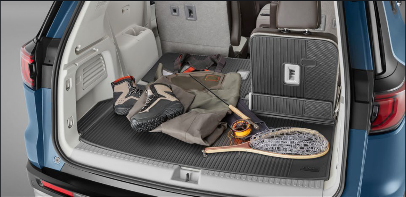
TAPETE DE VINIL RÍGIDO DE COBERTURA EXTENDIDA EN NEGRO