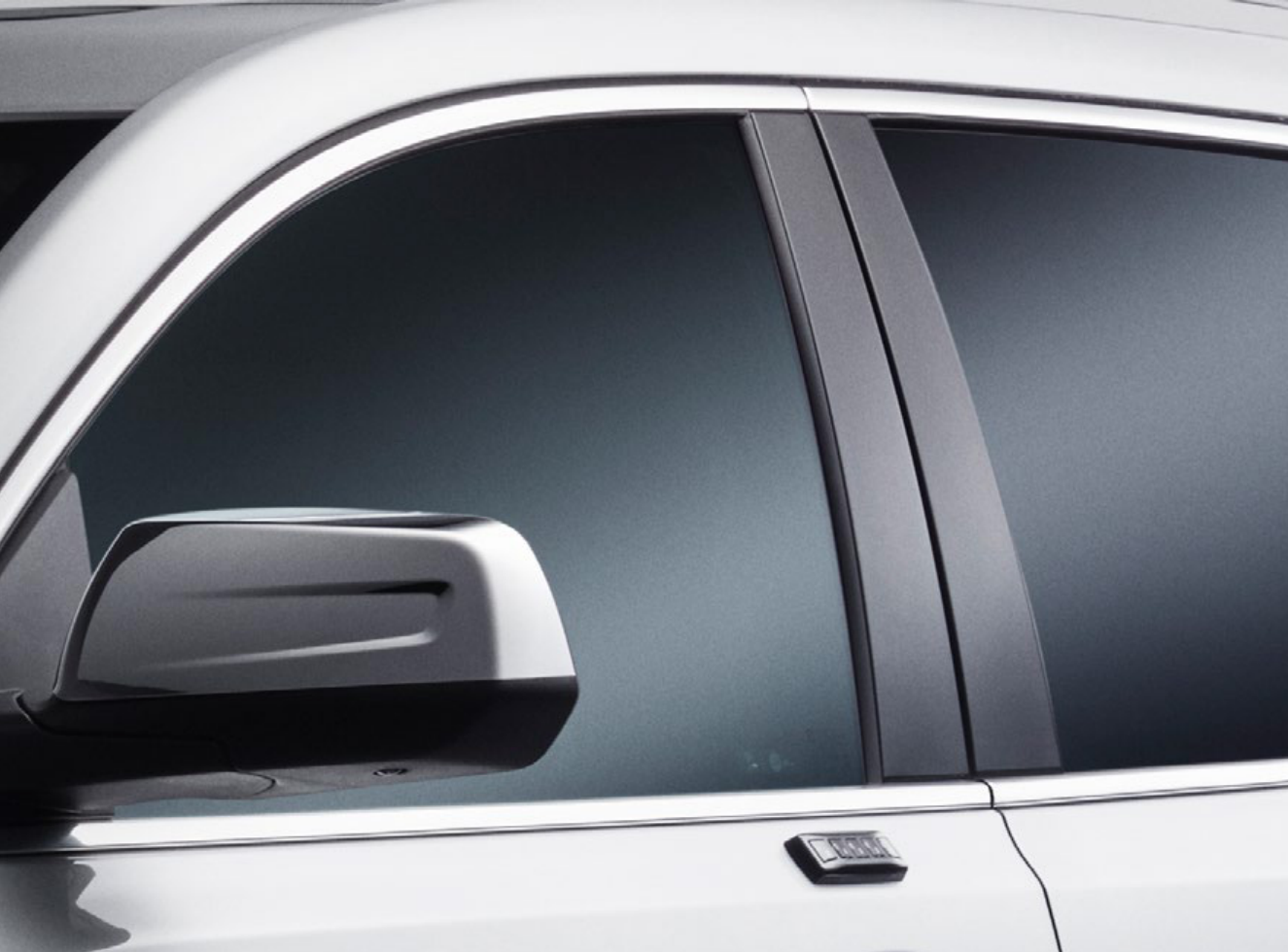
PELÍCULA DE SEGURIDAD Y CONTROL SOLAR