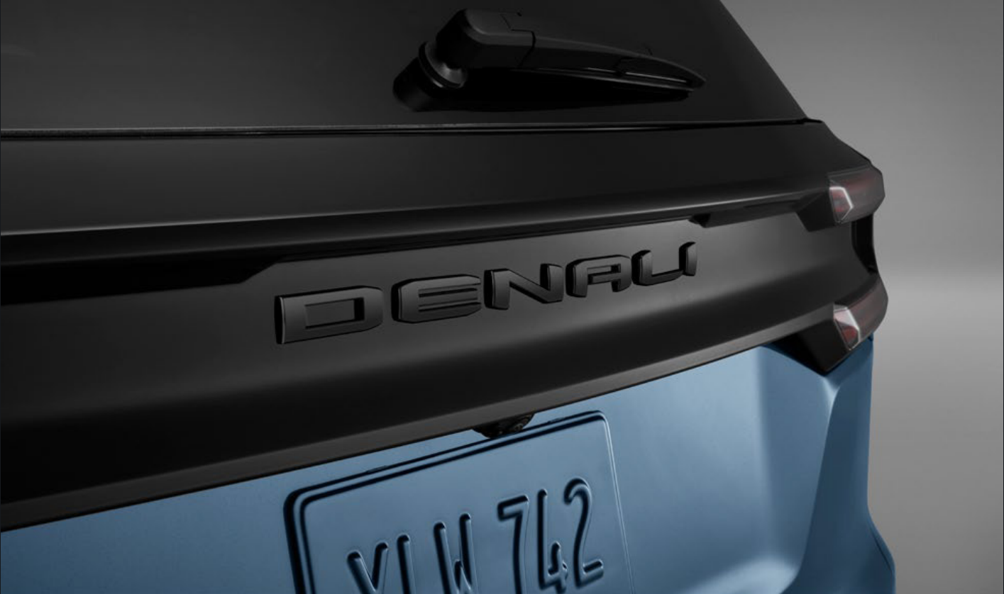
EMBLEMA DENALI EN NEGRO