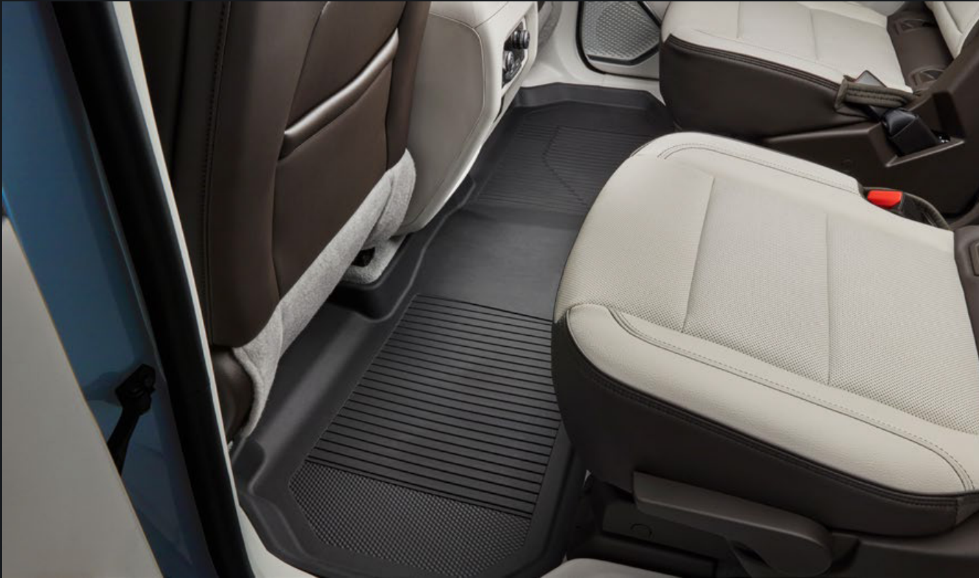
TAPETE DE VINIL RÍGIDO DE 2DA FILA EN NEGRO