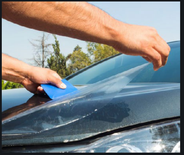
PELÍCULA DE PROTECCIÓN DE PINTURA