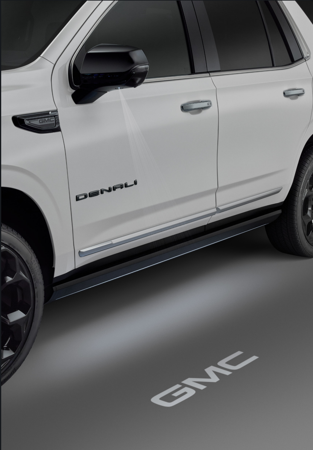
PROYECTOR DE LOGO