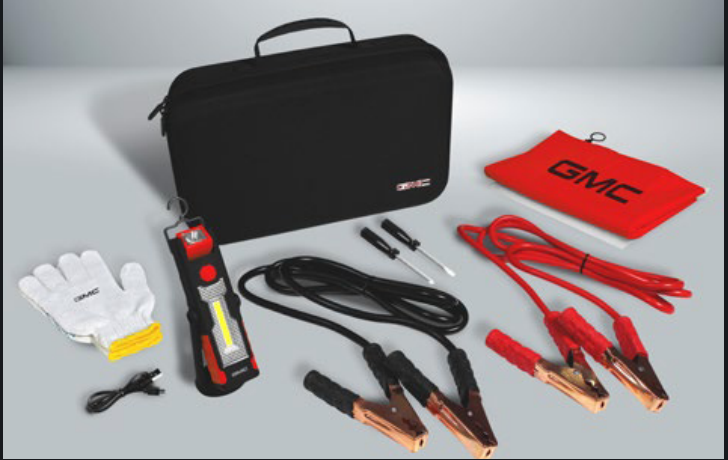
KIT DE EMERGENCIA BÁSICO