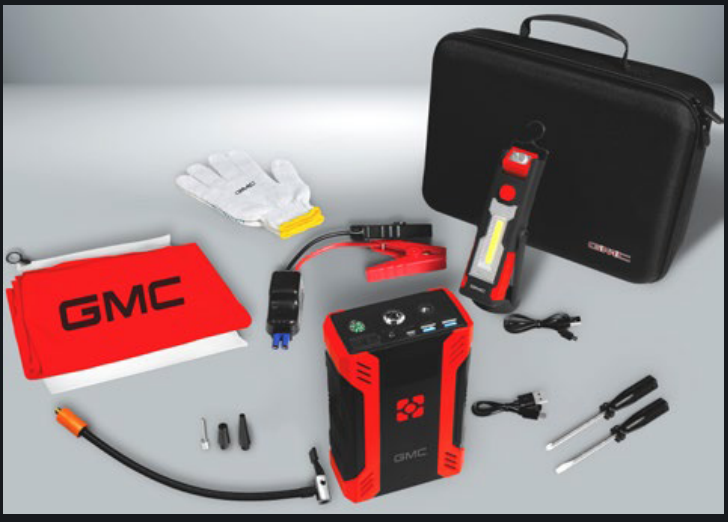
KIT DE EMERGENCIA PREMIUM