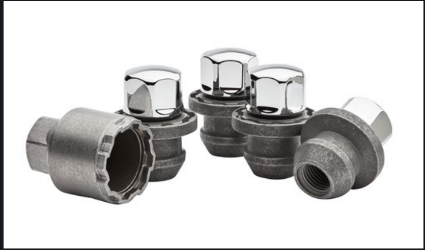
BIRLOS EN CROMO