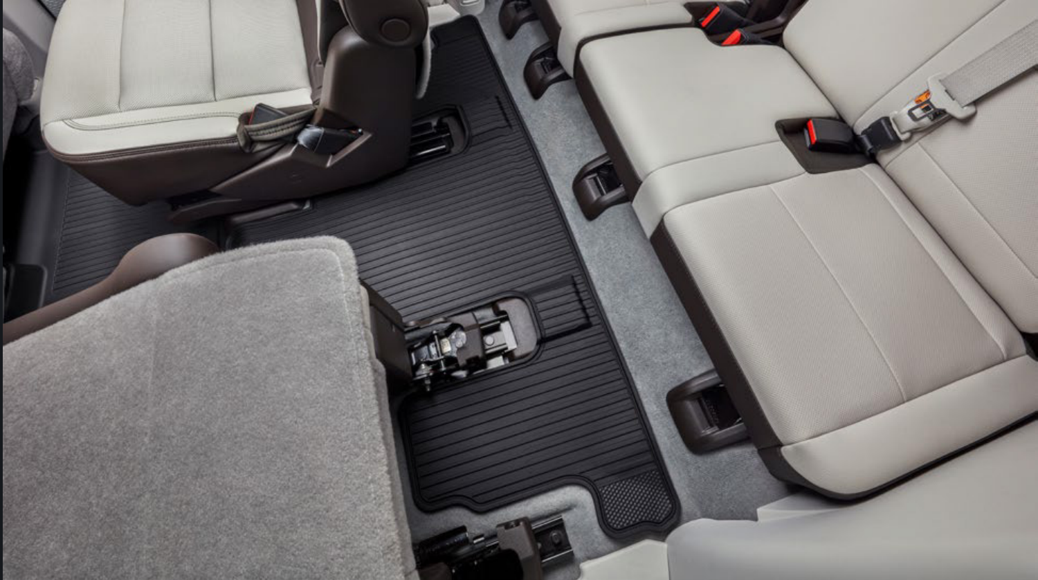
TAPETE DE VINIL RÍGIDO 3RA FILA NEGRO (PARA MODELOS 2DA FILA CAPITÁN)