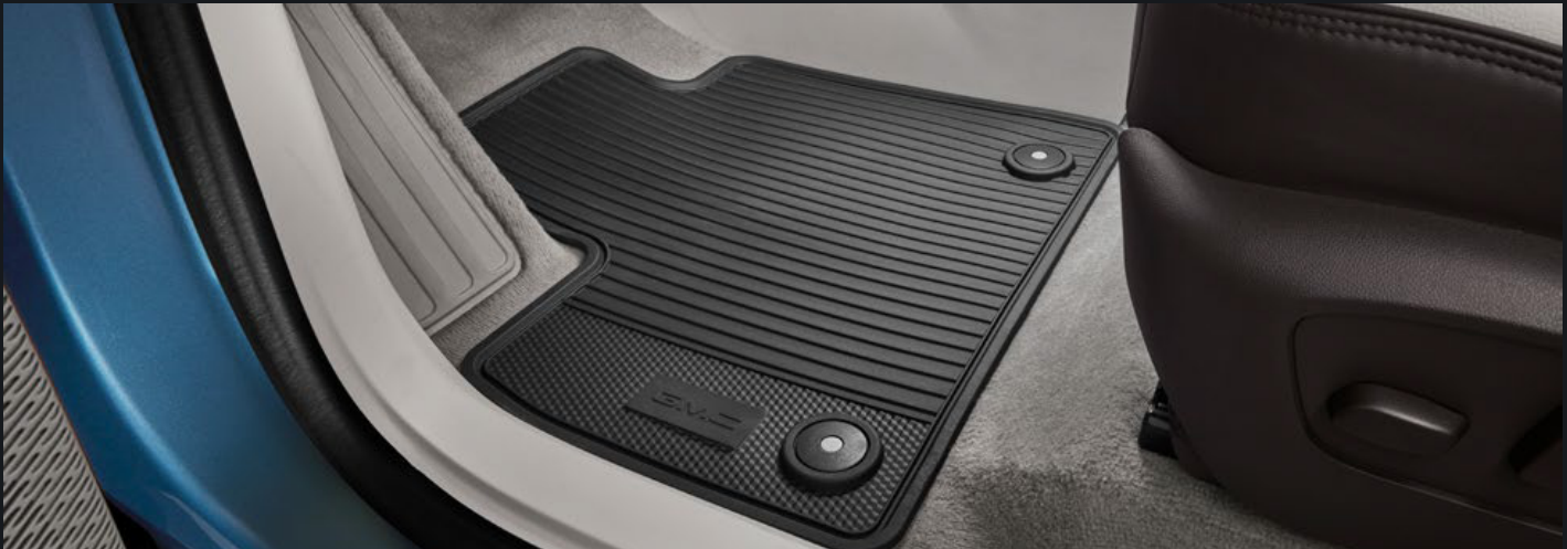
TAPETE DE VINIL 1ERA FILA EN NEGRO CON LOGO GMC