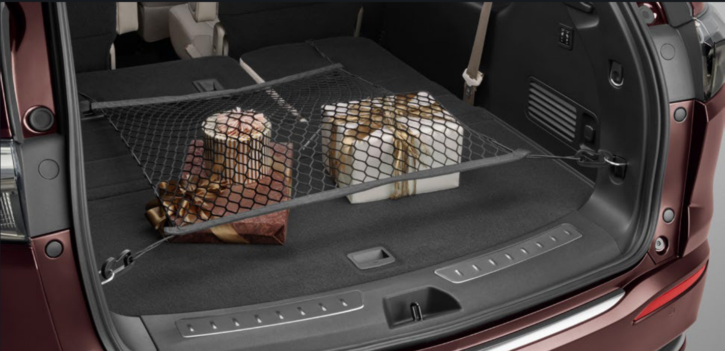
RED DE CARGA HORIZONTAL