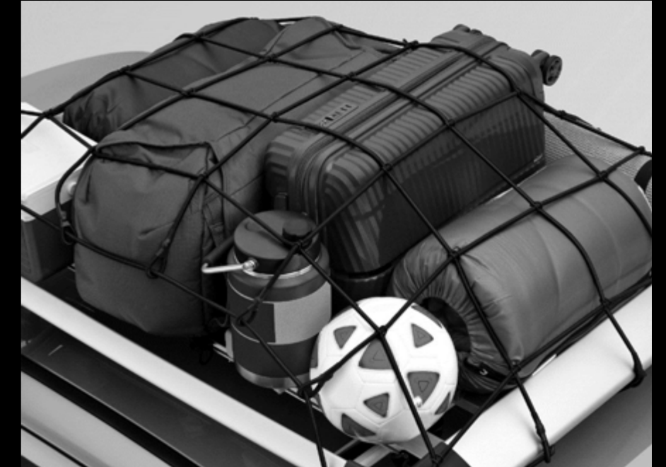
Red de carga para techo