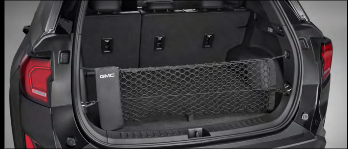
Red de carga vertical con logo GMC