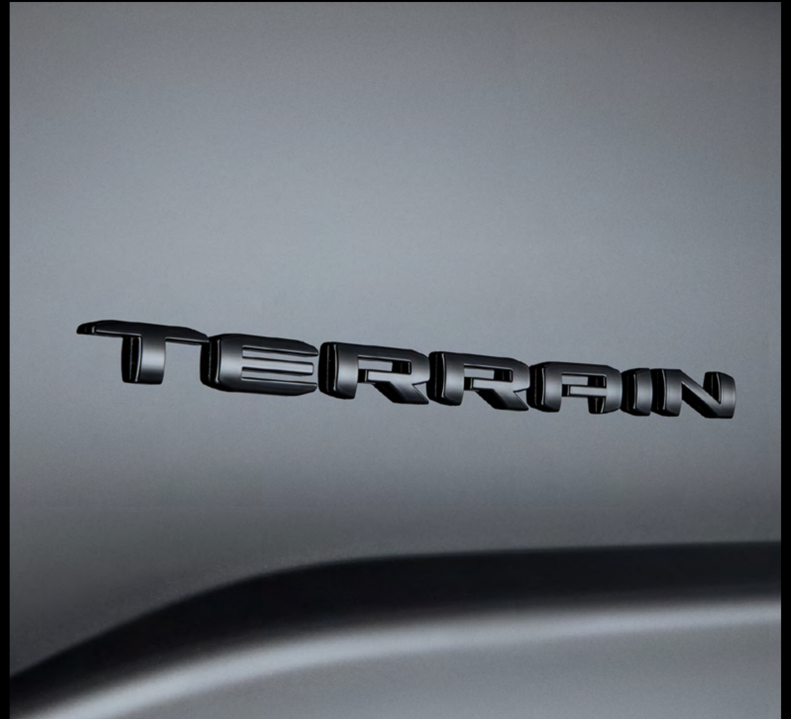
■ Emblema TERRAIN en negro