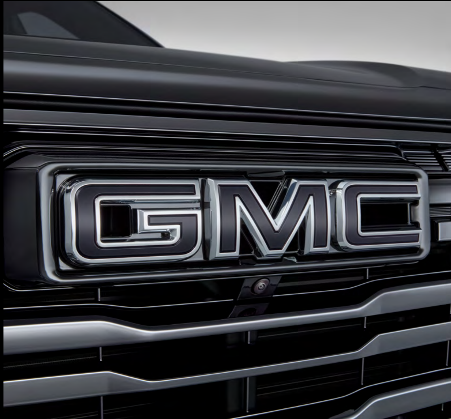
■ Emblema GMC en negro