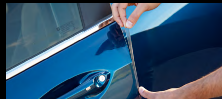
Cinta de protección de pintura para filos de puerta