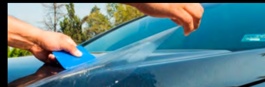
Rollo de película de protección de pintura 24"x100ft