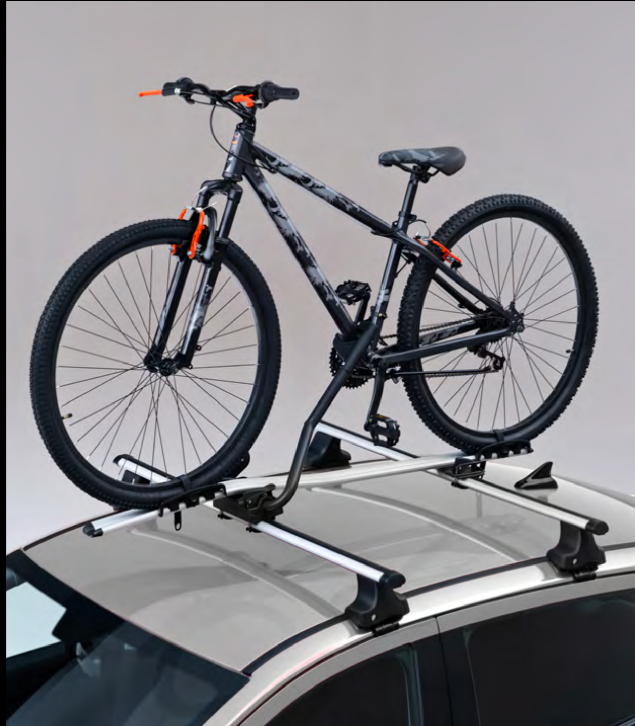
Portabicicletas de techo