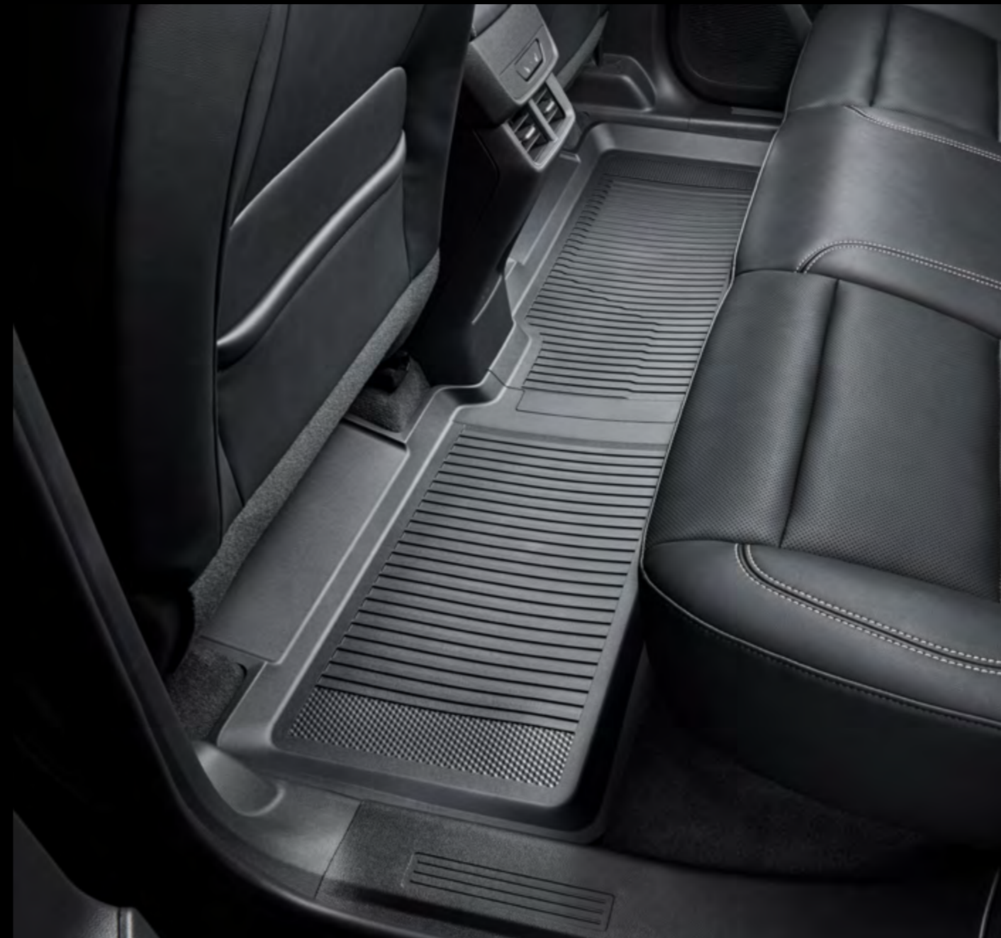
Tapetes de vinil rígido de 2.ª fila