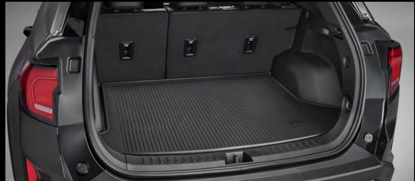
Tapete de vinil de cajuela