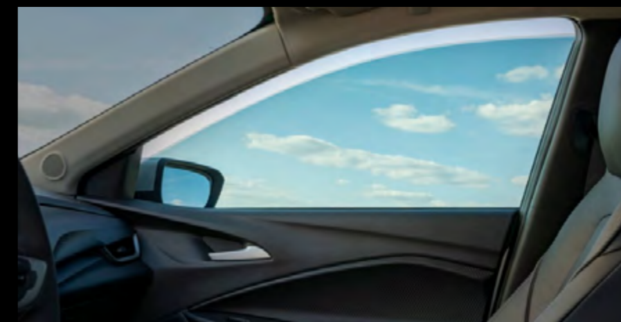
Películas de seguridad