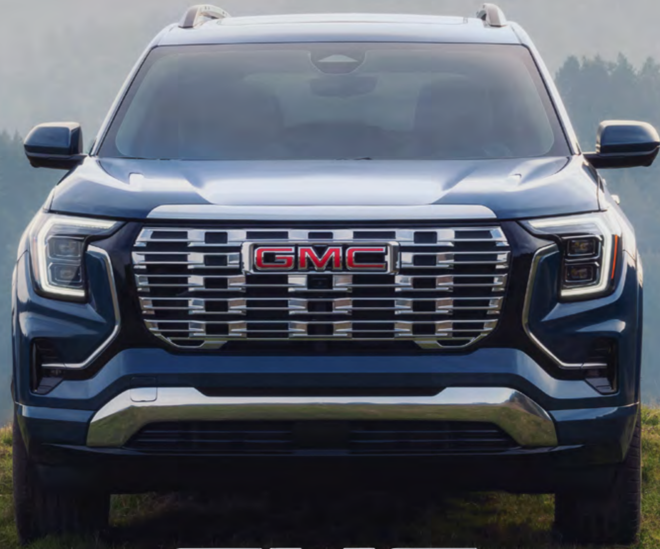
Imagen de carácter ilustrativo.