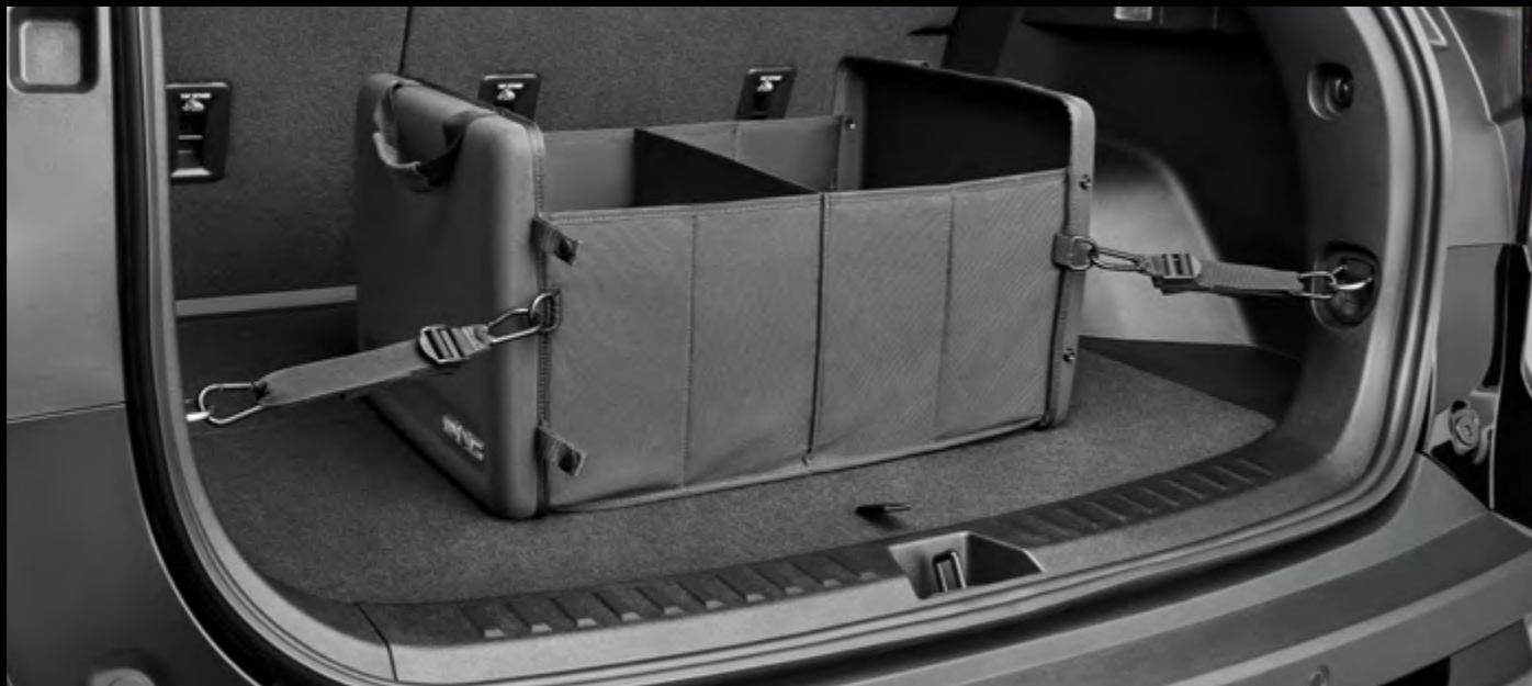
Organizador de cajuela