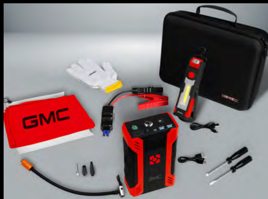
Kit de emergencia premium