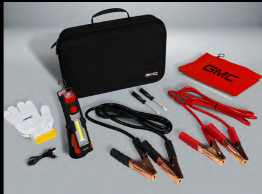
Kit de emergencia básico