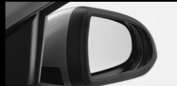
Protector de espejo