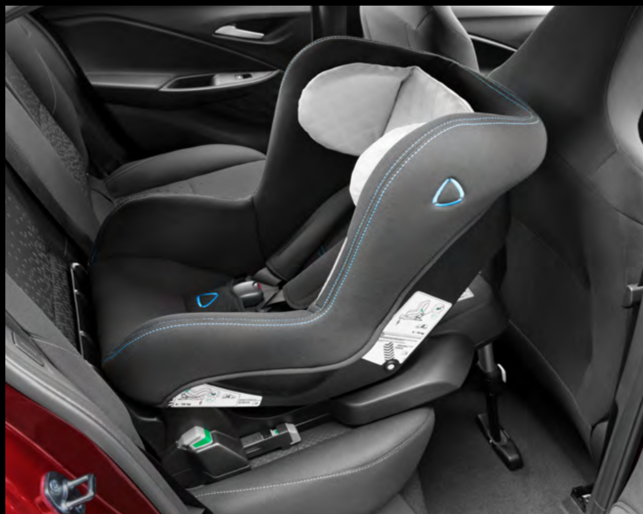
Base y silla para bebé