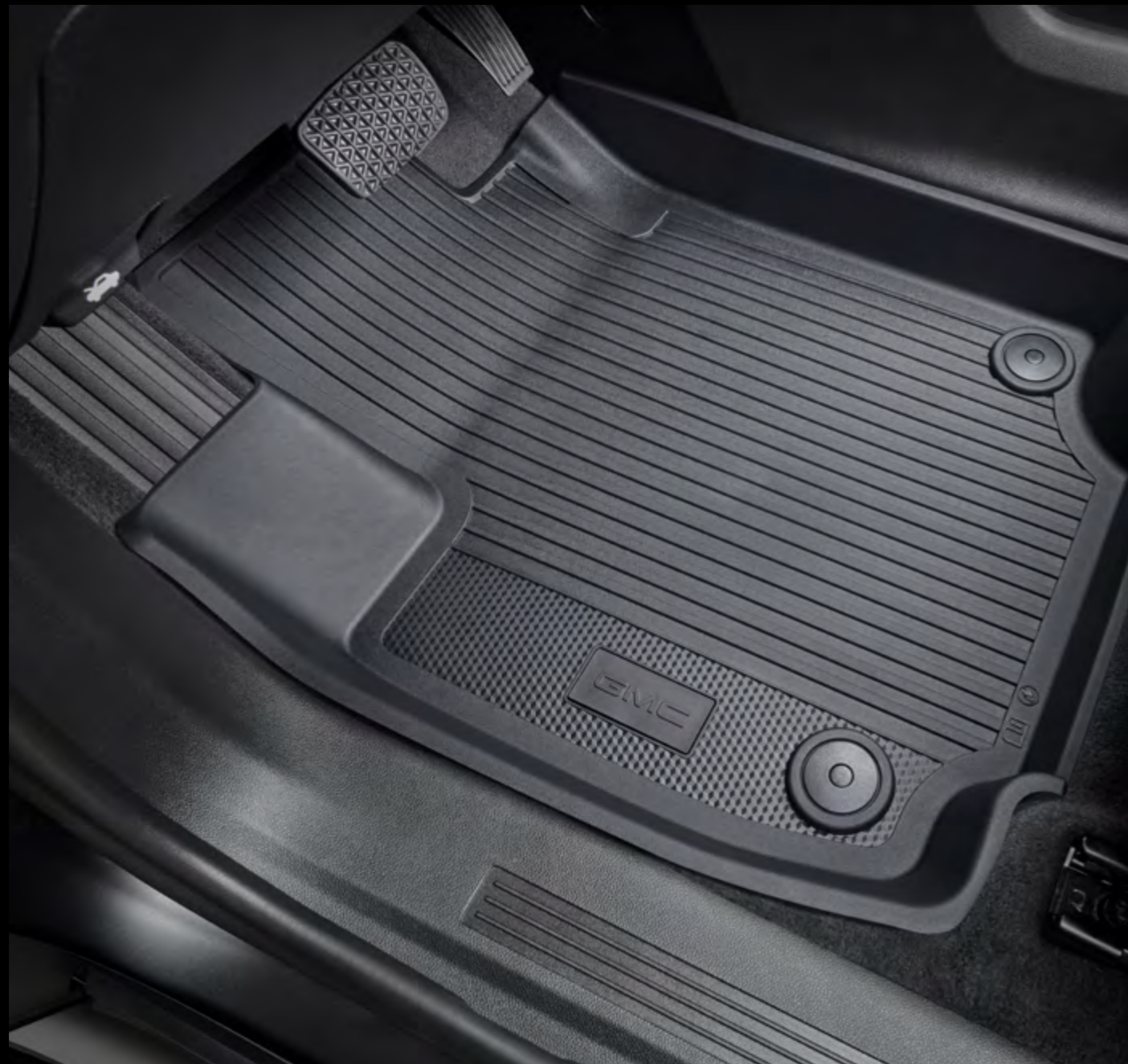
Tapetes de vinil rígido de 1.ª fila con logo GMC