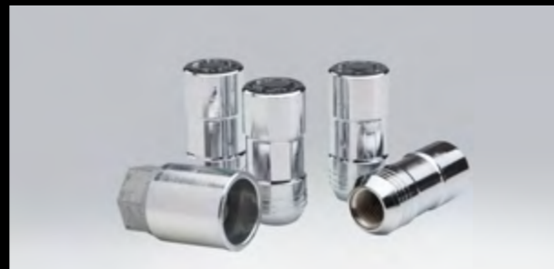
Birlos de seguridad en cromo