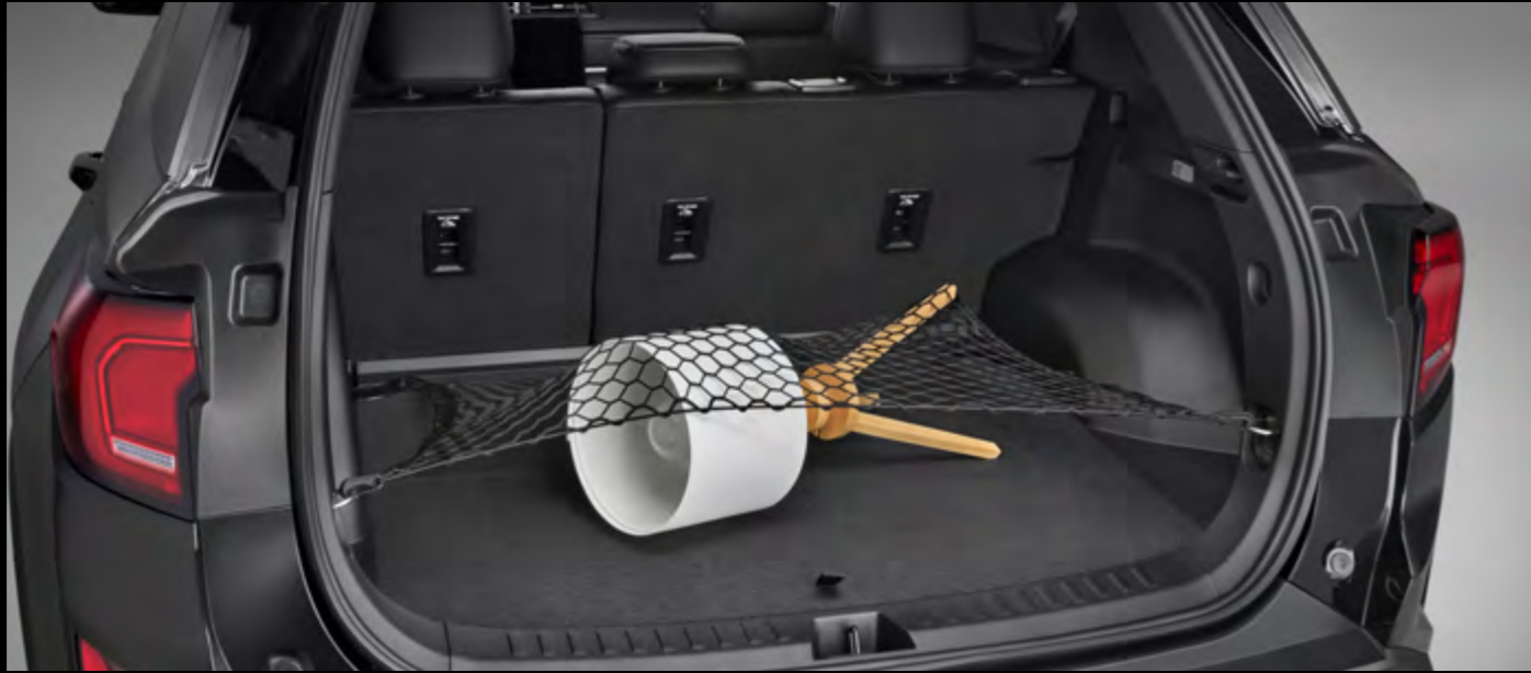
Red de carga horizontal