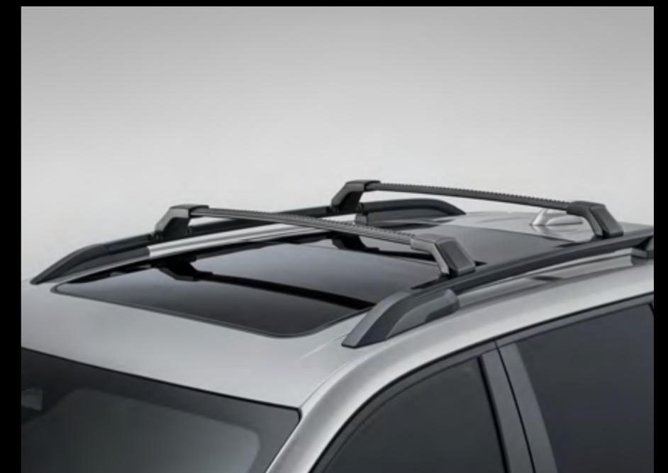
Barras de techo