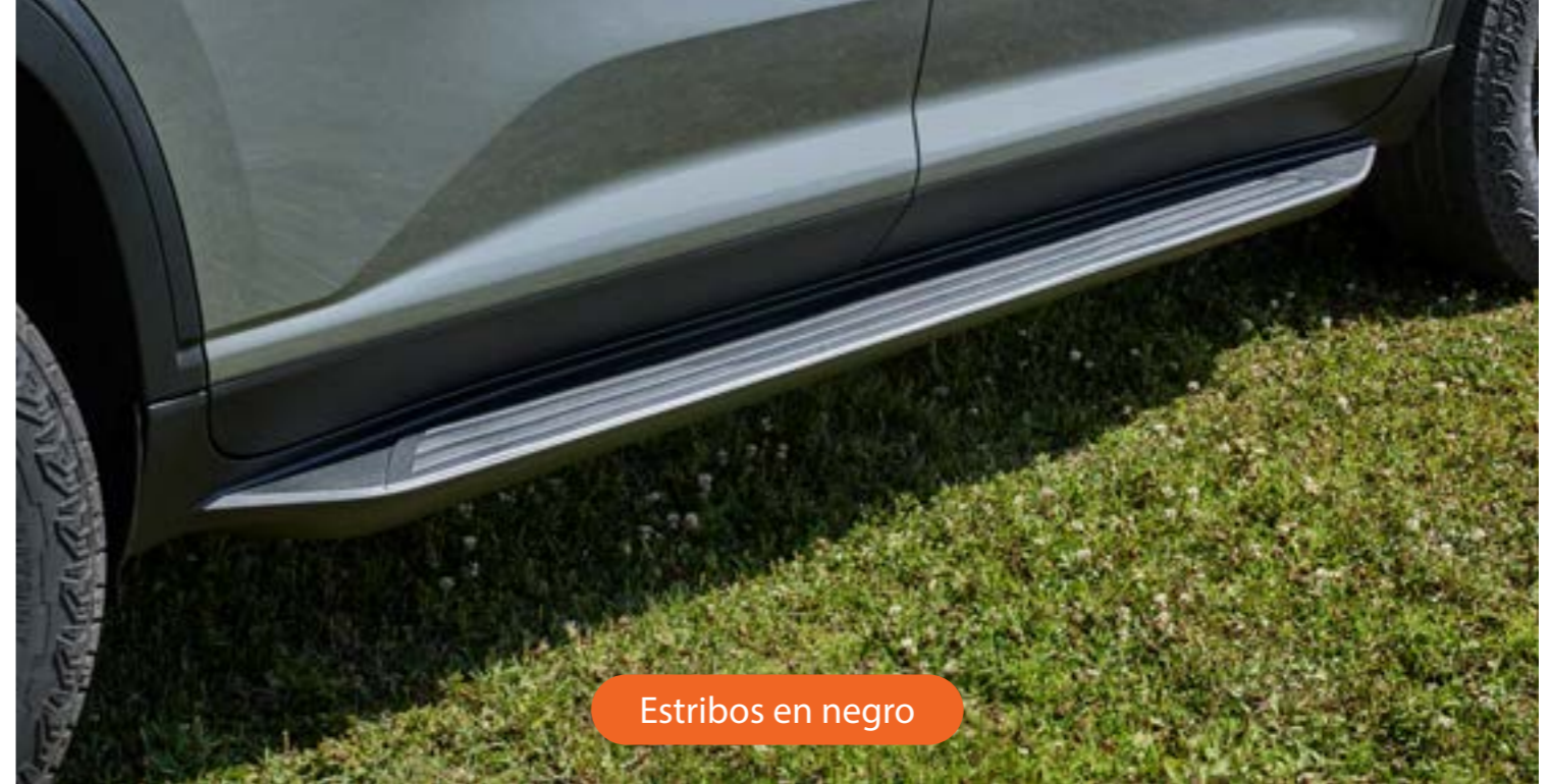
Estribos en negro