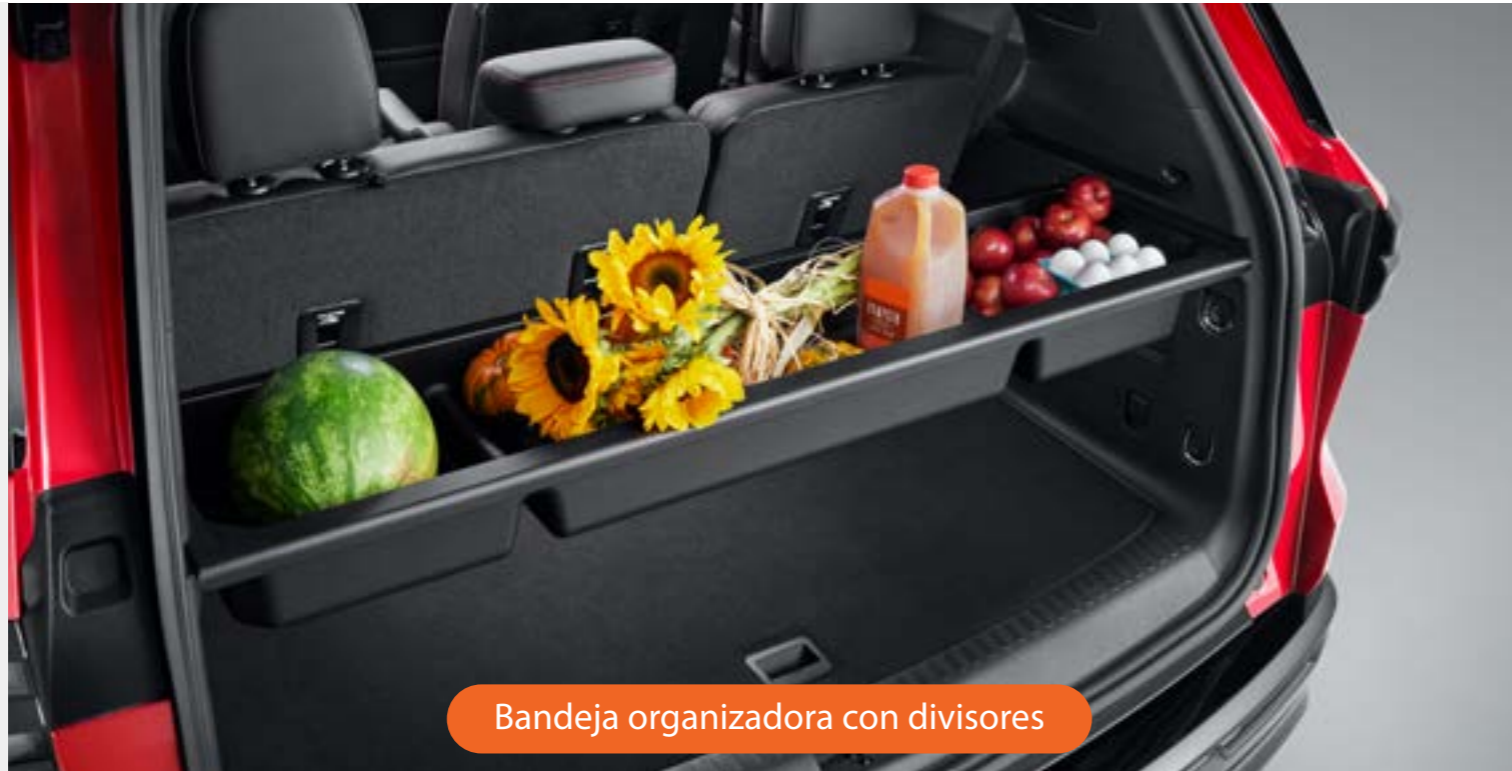
Bandeja organizadora con divisores