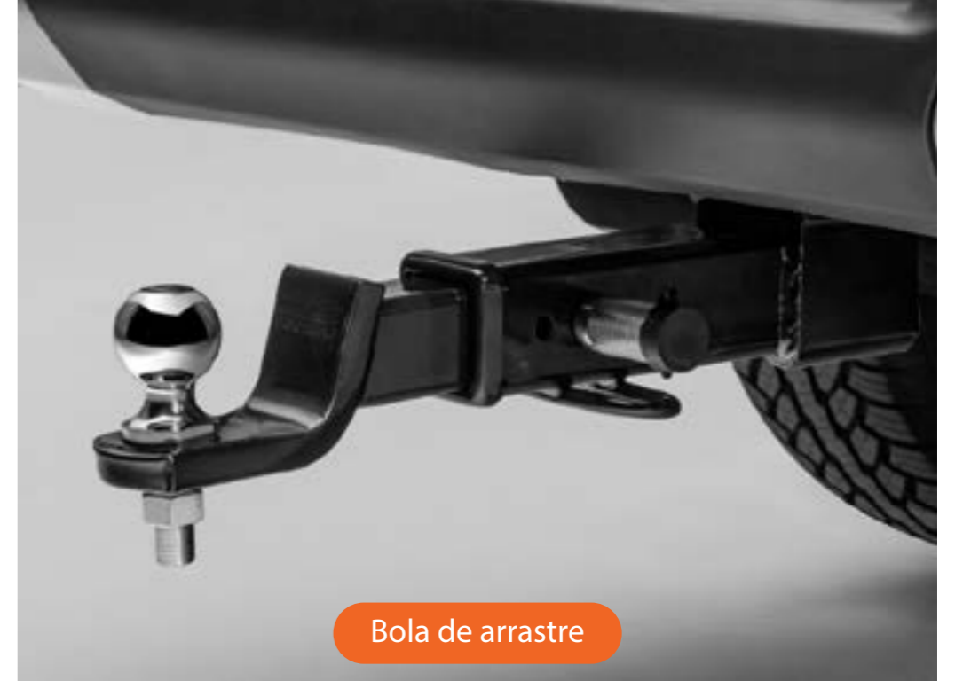
Bola de arrastre