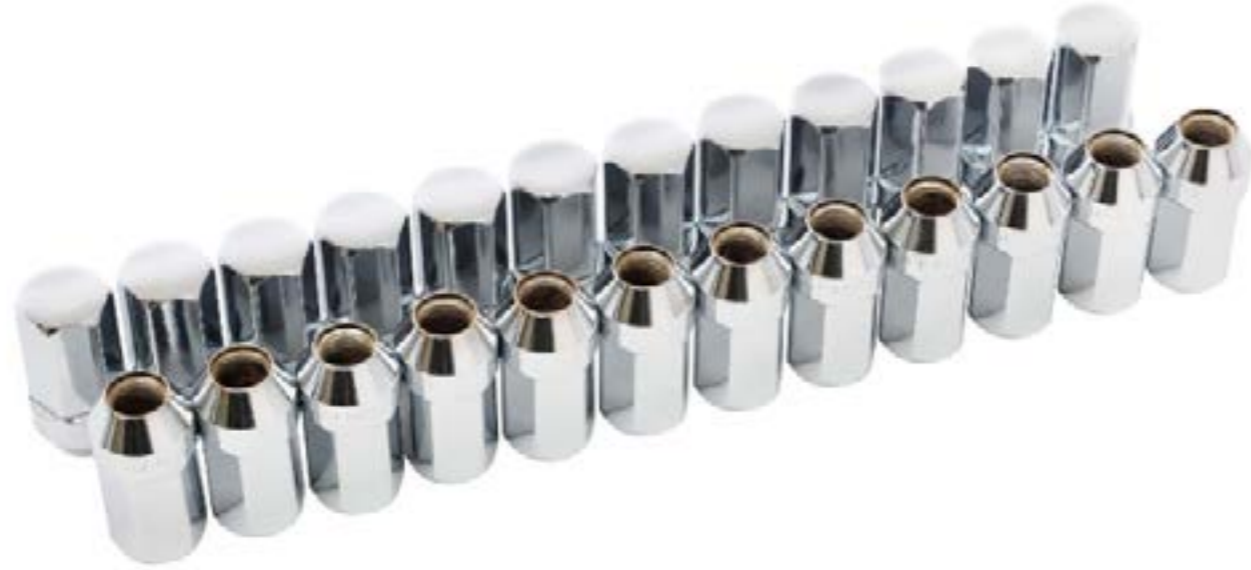
Birlos en acabado en cromo