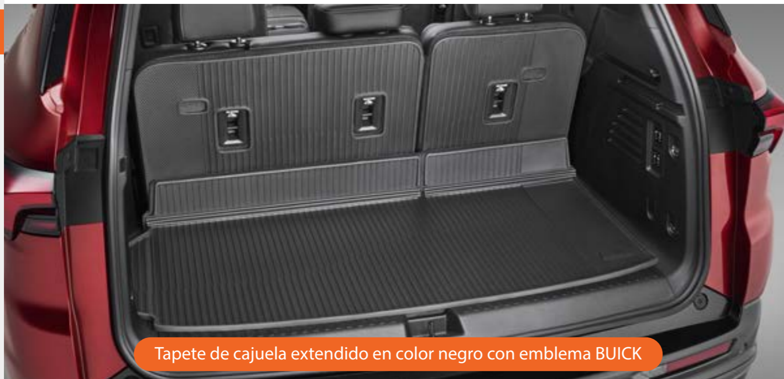
Tapete de cajuela extendido en color negro con emblema BUICK