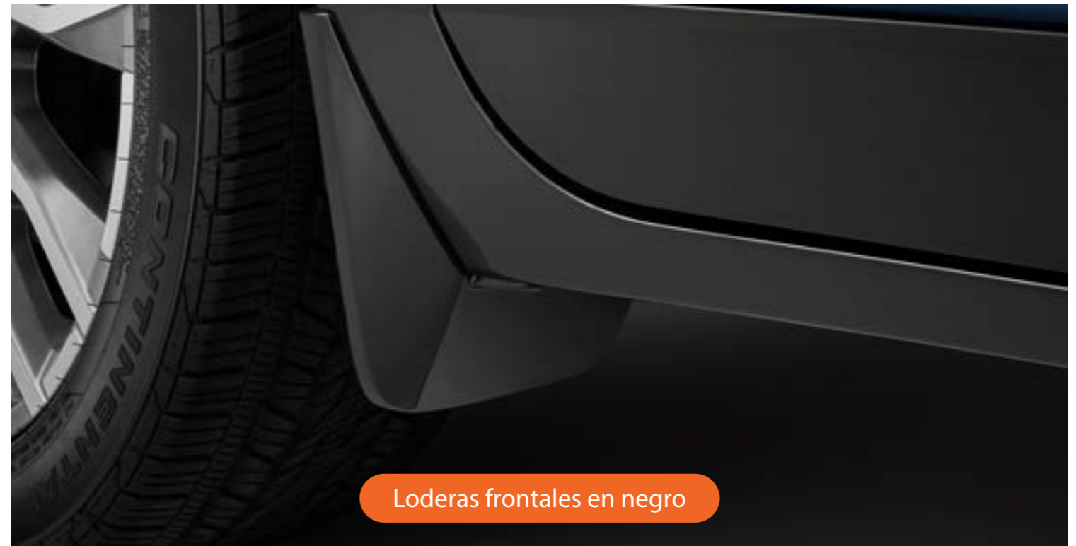
Loderas frontales en negro