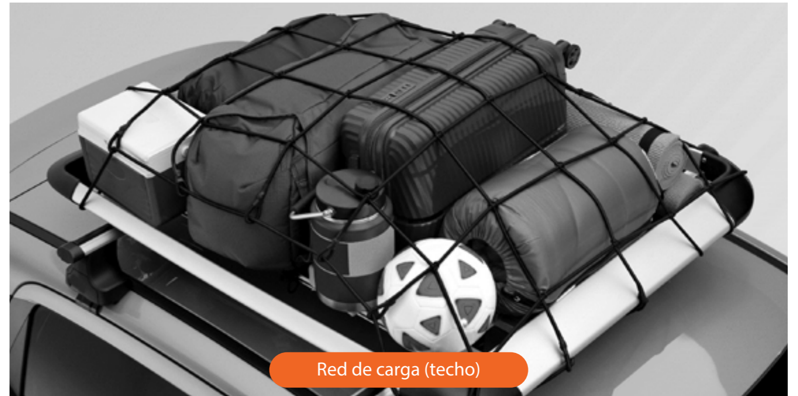
Red de carga (techo)