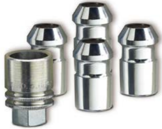
Birlos de seguridad en cromo