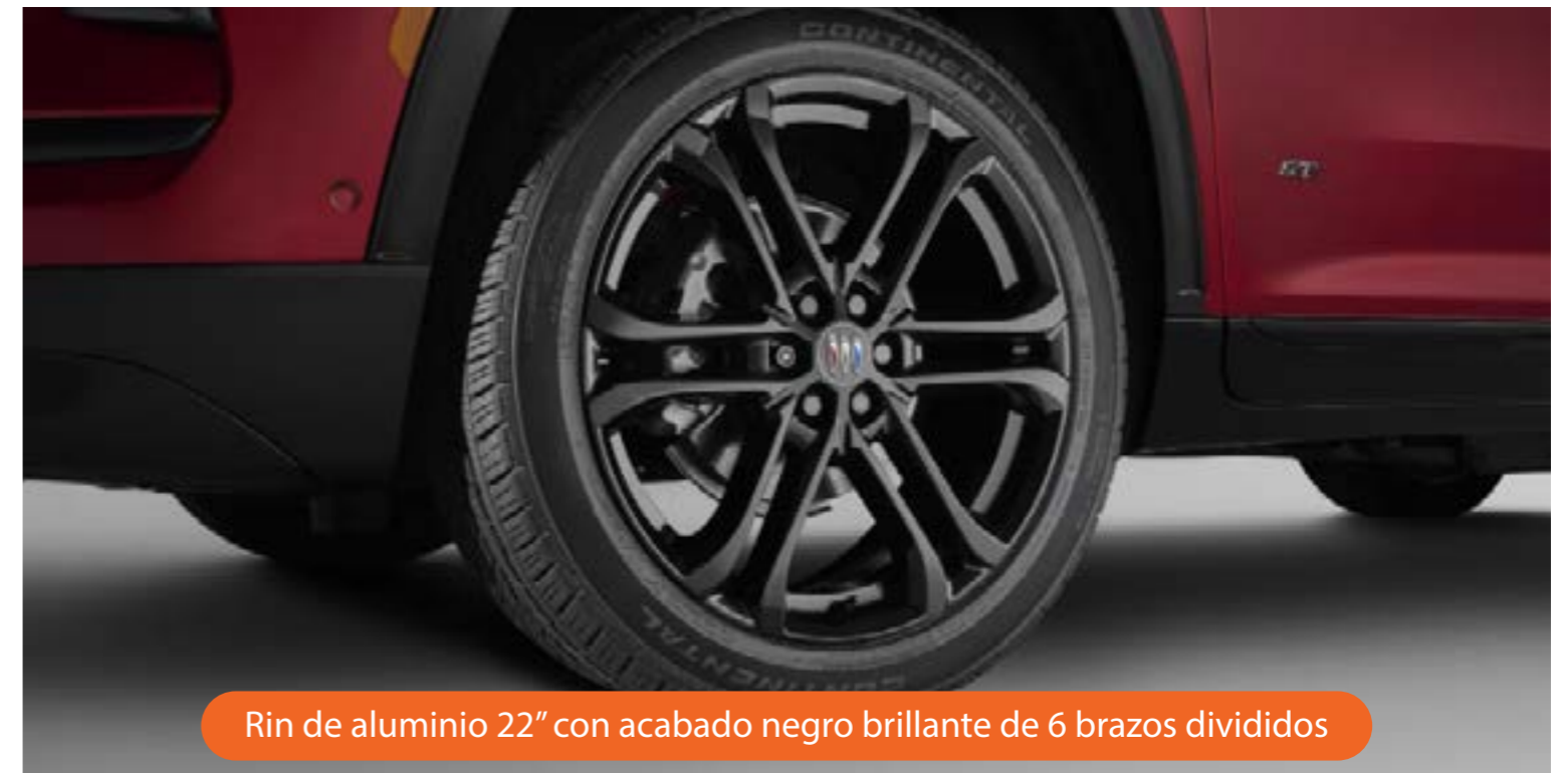
Rin de aluminio 22" con acabado negro brillante de 6 brazos divididos