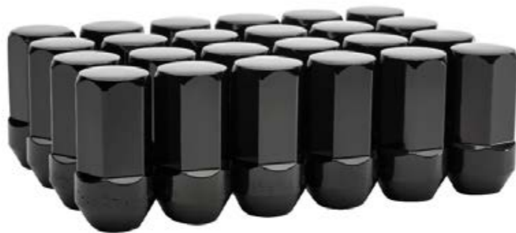
Paquete de birlos en negro (24 piezas)