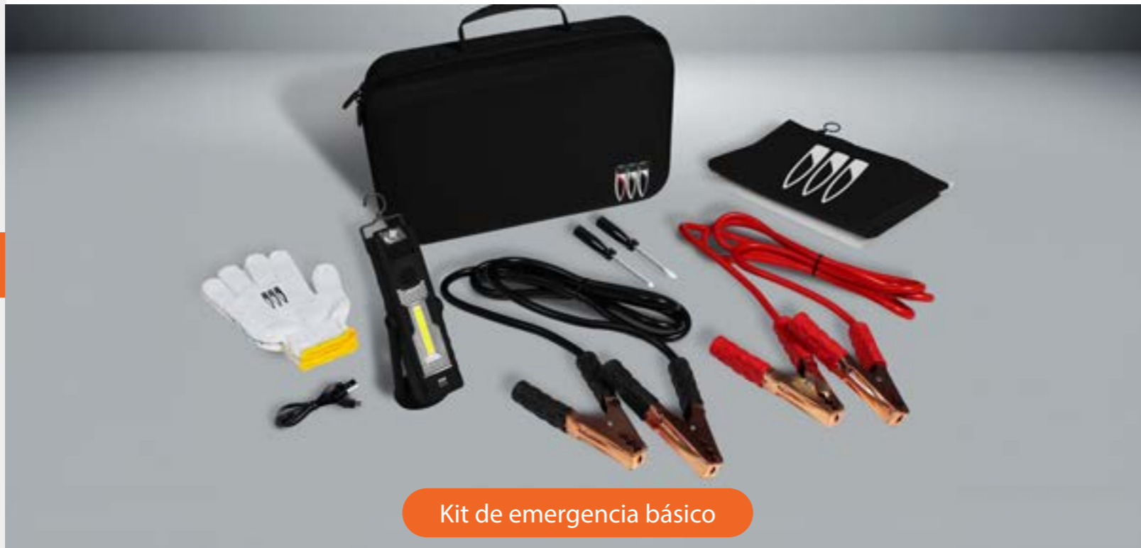
Kit de emergencia básico