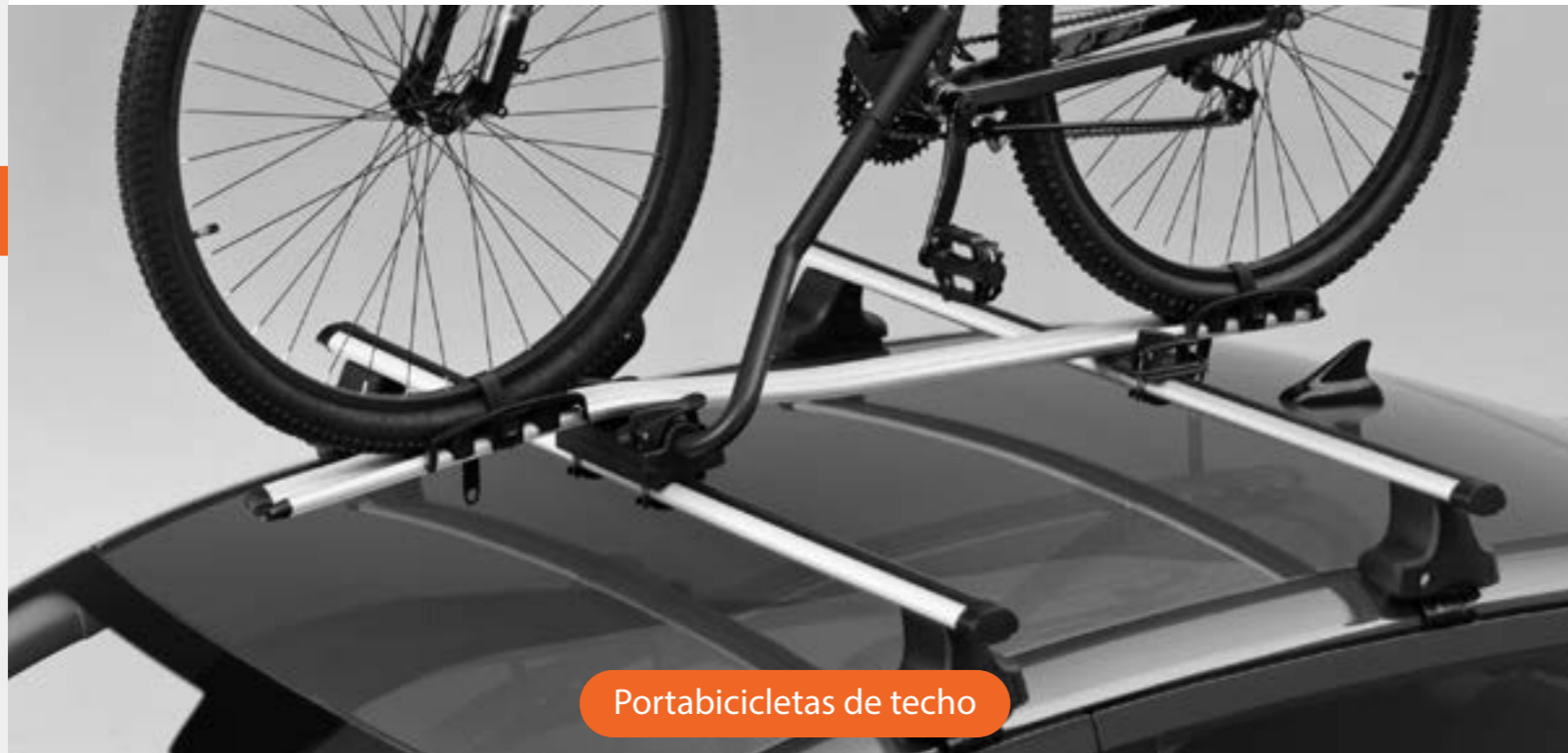
Portabicicletas de techo