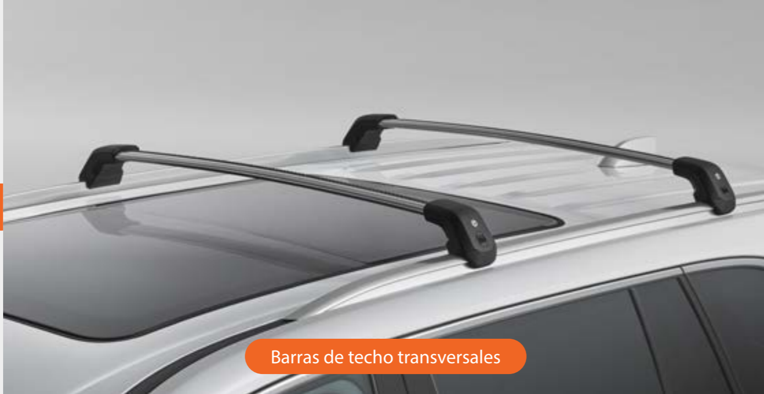
Barras de techo transversales