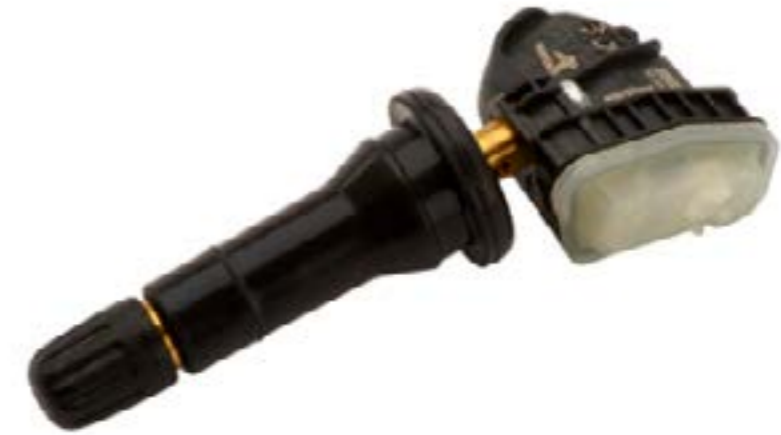
Monitor de presión de llantas (XL8 - 433 MHz)