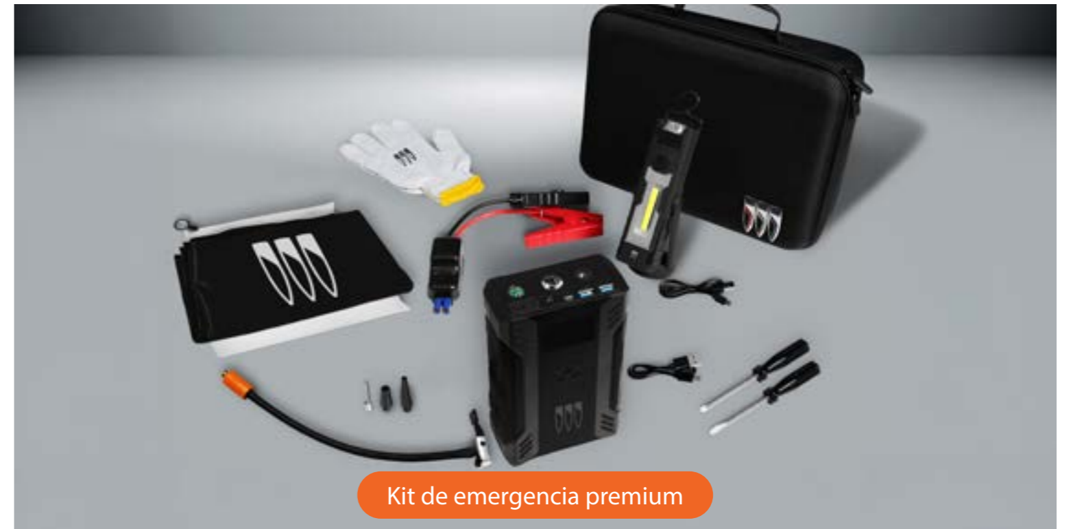
Kit de emergencia premium