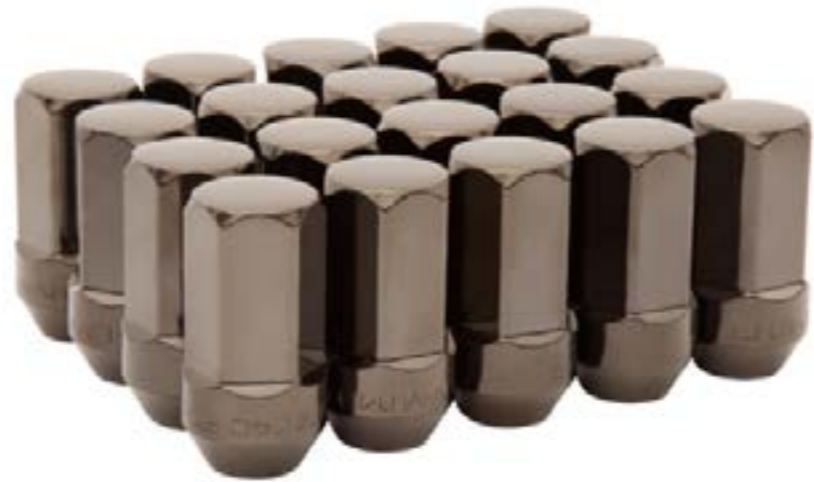
Birlos en negro