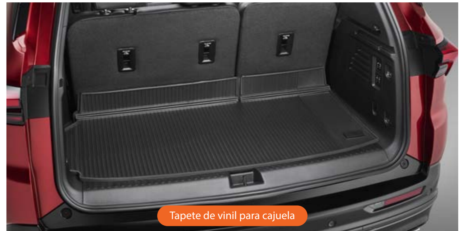
Tapete de vinil para cajuela