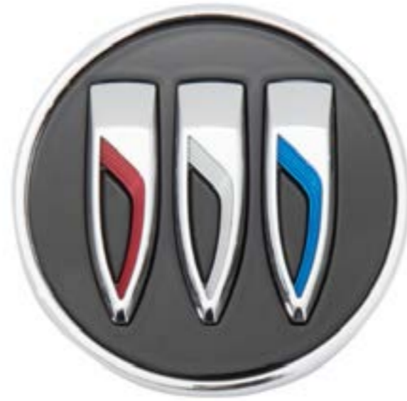
Centro de rin en negro con logo BUICK