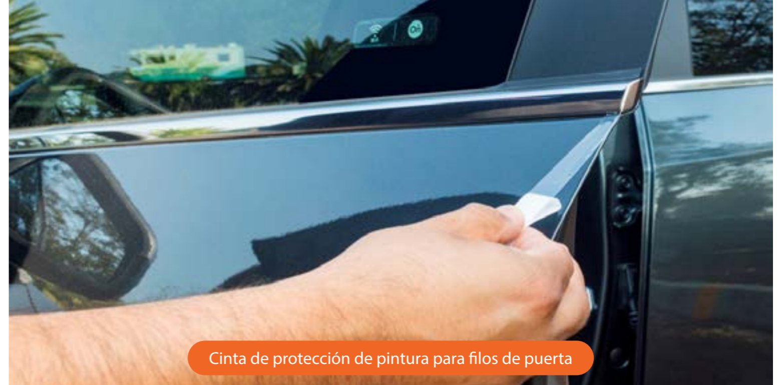
Cinta de protección de pintura para filos de puerta