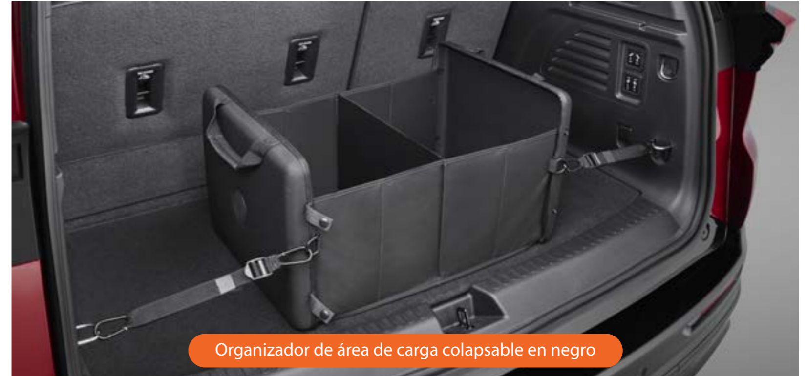
Organizador de área de carga colapsable en negro